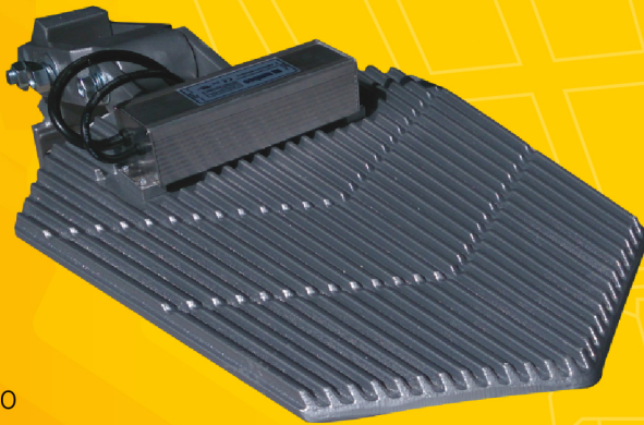
MOD. ACRUX 90

Luminaria ACRUX90 para alumbrado público. Tecnología led de alto rendimiento y eficiencia. Su diseño frontal con forma aerodinámica, estética y duradera genera un ambiente atractivo y ofrece larga vida útil. Fabricada en aluminio con acabado en pintura electrostática. Cuenta con protección IP66.